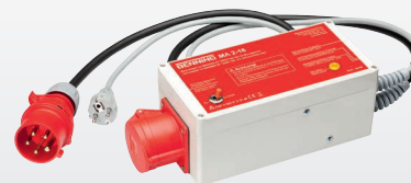
BENNING MA 2-16 (044160)