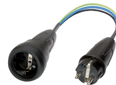
Messadapter (044131) z.B. für CM 9-1